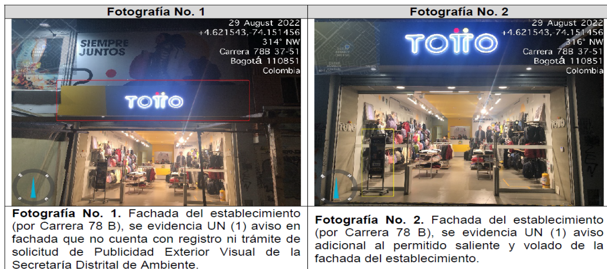
Tabla 3. Registro fotográfico

Valoración técnica y conductas generales evidenciadas (Ver Anexo No. 1. Acta de Visita No. 204780)